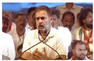
కొల్లూరి. అక్టోబర్ 31 యదార్చవాది ప్రజా తెలంగాణ. దొరల తెలంగాణ మధ్య ఈ ఎన్నికలు జరిగినప్పటికీ కాంగ్రెస్ పార్టీ ఆగ్రహం