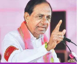
నల్లగొండ జిల్లా : యదార్చవాది సింం కేసీఆర్ నియో జతపడ్డాడో సుడిగాలి

పర్యటనలు చేస్తున్నారు. ప్రజా అసెంబ్లీ సభల్లో పాల్గొంటూ అభివృద్ధిని గెలిపించే లక్ష్యం తున్నాడు. మిర్జాపూర్ ప్రజా అసెంబ్లీ సభలో సింం కేసీఆర్ ప్రజలను దుబారా అన్న తెలంగాణ కాంగ్రెస్ ఎంపీ ఉత్తమమూర్తి రెడ్డి వ్యాఖ్యానించారు. ఈ సందర్భంగా సింం కేసీఆర్ మాట్లాడుతూ.. కాంగ్రెస్, బీజేపీ ఎవరో ఒకరు వస్తారు. బీఆర్ఎస్ వచ్చిన రోజు నుంచి ఉలివచ్చింది. కాంగ్రెస్